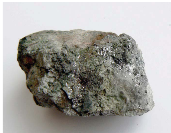
Рисунок 3 – Кристаллы рениита в вулканической породе

тепловой баланс фумарольной системы вулкана Кудрявый определяется смешением высокотемпературных газов с метеорными водами, которое происходит на глубине порядка 120 м от уровня грунтовых вод в теле вулкана [19].